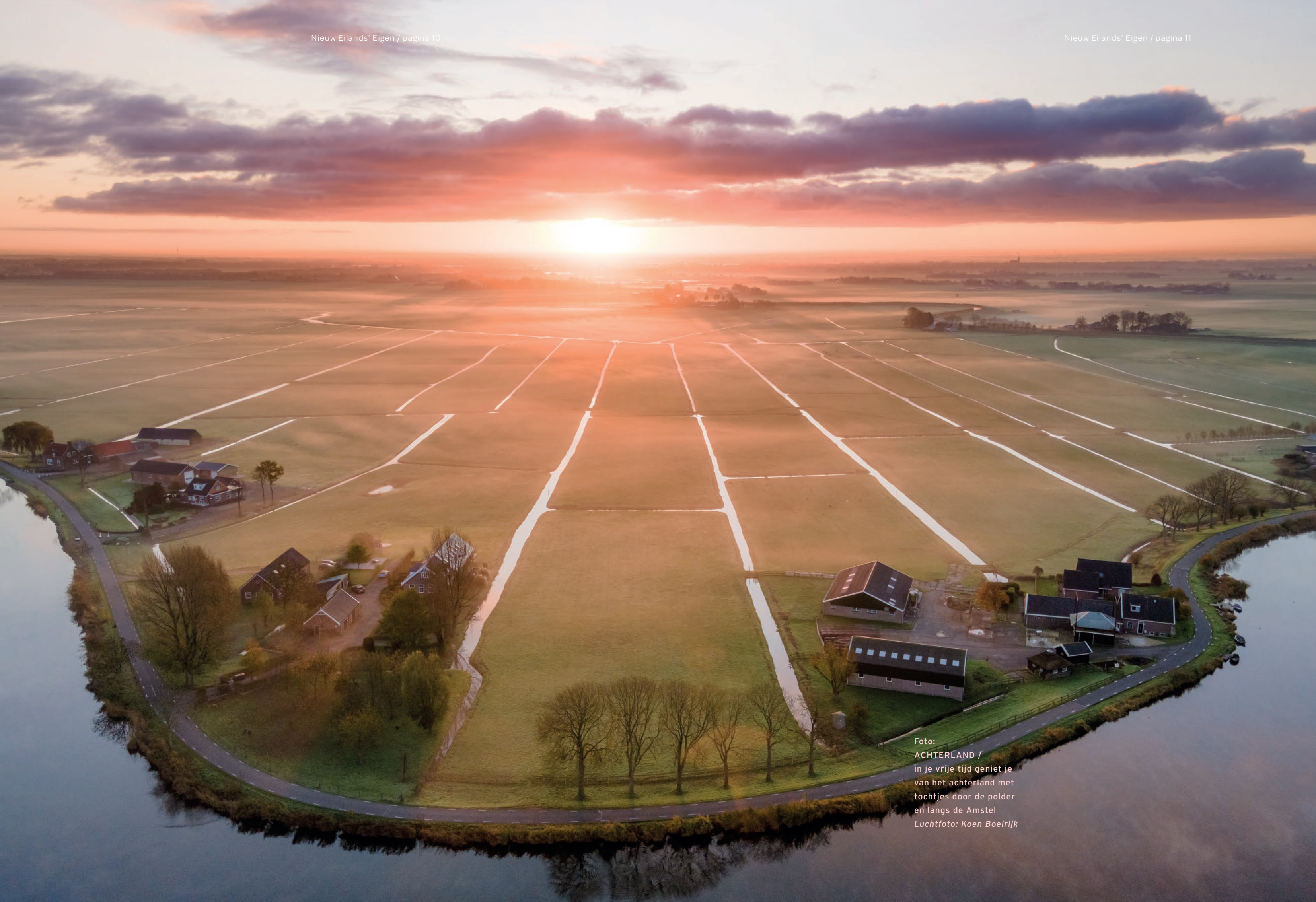
Foto: ACHTERLAND / In je vrije tijd geniet je van het achterland met tochtjes door de polder en langs de Amstel Luchtfoto: Koen Boelrijk