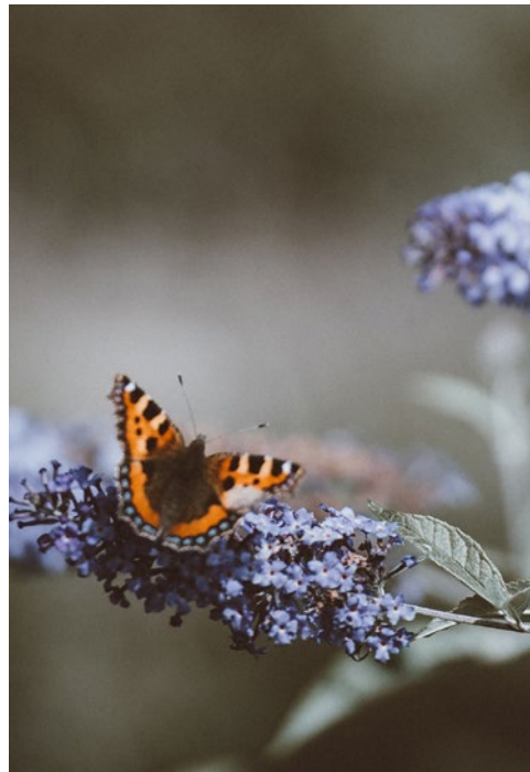
Foto's: LEEFBAARHEID / de groene en waterrijke omgeving maakt de wijk aantrekkelijk